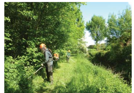
Fauche différenciée, quartier des Hantes à Pontault-Combault

C'est ce programme, défini par le technicien de rivière et validé par les élus, et couvrant les trois villes qui vous est présenté dans le plan ci-dessus, les trois premières actions concernant Pontcarré.