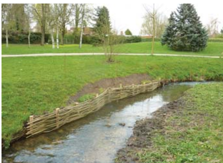
Maintien de berge, Parc des Sources à Roissy-en-Brie

Le Morbras s'étend sur 10 km, ses affluents sur 7 km et le bassin versant couvre 28,4 km 2 , pour sa partie Seine-et-marnaise.