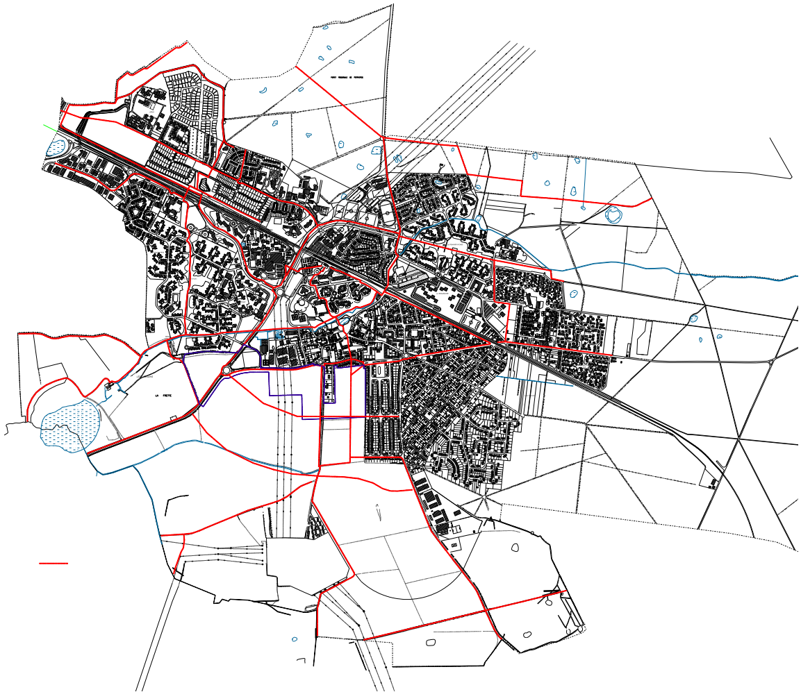
Circulations piétonne et cycliste existantes et projetées.

Le projet favorise une irrigation importante des circulations sur le territoire que ce soit d'une part, en confortant les axes structurants à l'échelle intercommunale et en valorisant les différentes entrées dans le bourg ou d'autre part, en permettant les circulations douces pour les piétons et les cycles.