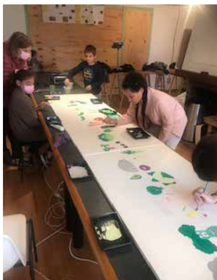
Animation avec des enfants « Les légumes et leurs saisons »