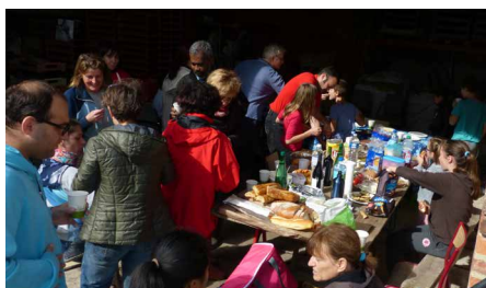
Après l'effort, le plaisir d'un temps et d'un repas partagés