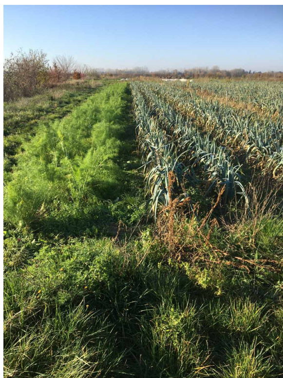
Cultures maraîchères à Toussacq destinées à une AMAP (77)

Nous proposons d'aider à créer une AMAP. La production sera assurée par un ou deux maraîchers à qui l'on proposera la location du terrain dans le cadre d'un bail agricole. En contrepartie il s'engagera à développer une activité maraîchère dont la production sera écoulée dans le cadre d'une AMAP et/ou en vente directe (sur place ou au marché). Cette activité s'inscrira dans le cadre du projet global, ce qui le conduira à y contribuer en des termes qui seront précisés avec lui (possibilité d'accompagnement par l'AMAP de Pontault et le Réseau des AMAP IDF). Les structures du pôle Abiosol pourront accompagner la mairie dans la recherche de candidats à l'installation.