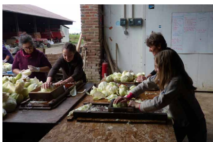
Un exemple de participation citoyenne : la fabrication de la choucroute par les amapiens à Toussacq (77)