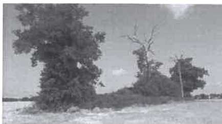
Le bosquet Rosalie, grignoté par les labours

Le ru de la Longuiolle doit faire l'objet d'aménagement améliorant la qualité de cet habitat. D'abord, la réouverture en amont de la zone d'étude, entre la route de Monthéty et l'Avenue du Général De Gaulle, doit être prévue (il s'agit d'une obligation du S.D.R.I.F.). Le développement d'une ripisylve constituée d'arbres d'essences locales et adaptées à la forte hygrométrie (Saules...) sera favorisé. Un cheminement piéton pourrait être imaginé le long du ru.