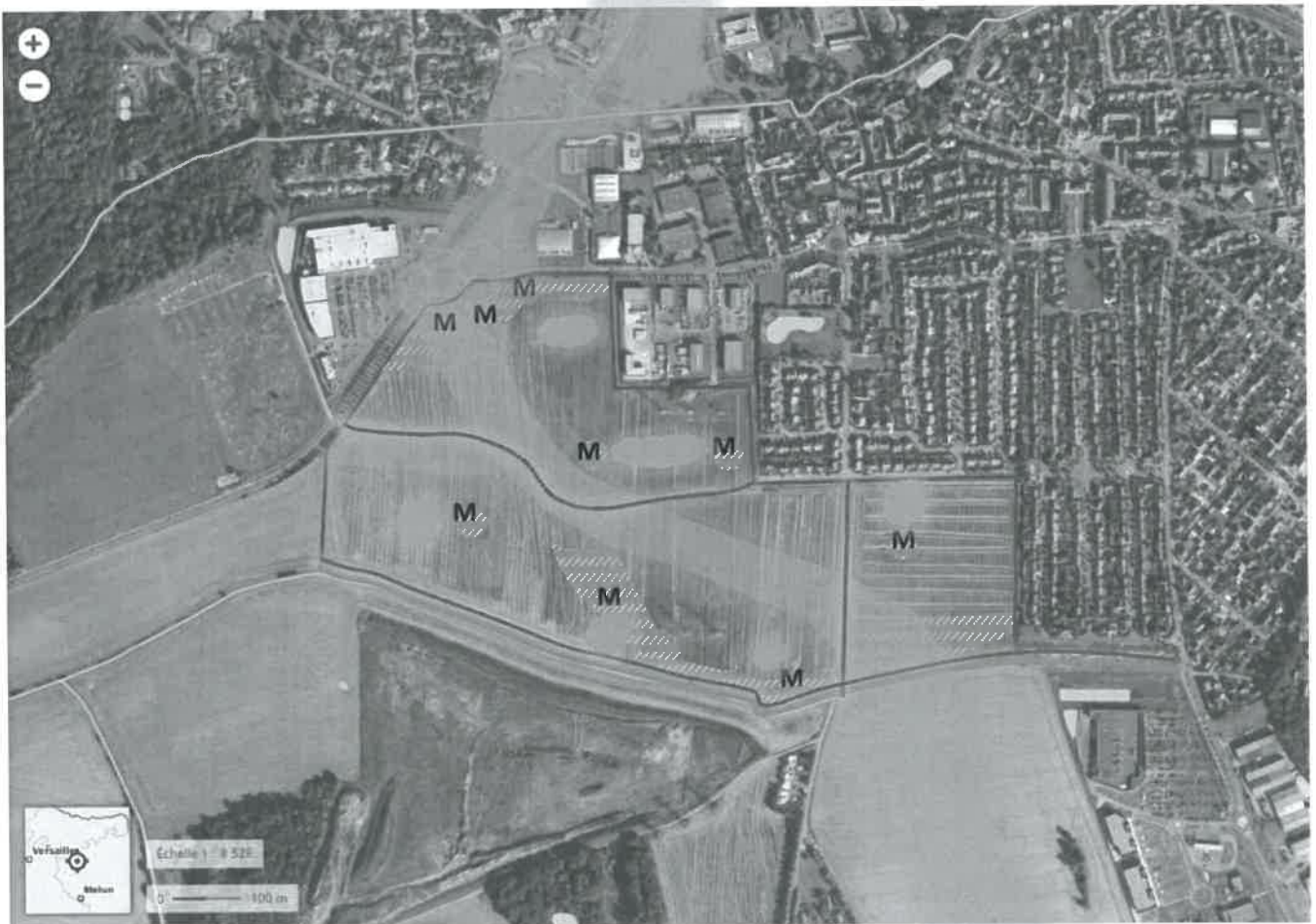
Carte synthétique des propositions pour la prise en compte des éléments naturels et agricoles dans le projet Plein Sud.

bois de la Lièvrerie...) afin de répondre aux objectifs du S.D.R.I.F. (espace de respiration et liaison agricole et forestière). Quelques bosquets pourront renforcer une liaison écologique forestière locale. A chaque mouillère ou milieu humide sera associé un espace boisé, connecté à ce milieu humide permettant à la faune batrachologique (grenouilles, tritons...) de se reconstituer.