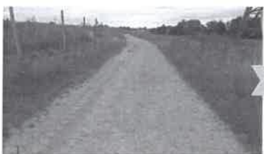
Le chemin de la Patrouille, vers Pontaut

La création de bosquets d'arbres et de haies d'essences locales et variées permettra d'accompagner ces milieux humides et de proposer une continuité écologique locale vers le bois des Berchères pour la faune forestière (amphibiens, chiroptères...). Associés aux mouillères, ils offriront un habitat d'hibernation pour des amphibiens se reproduisant dans des points d'eau peu profonds et peu végétalisés comme le Crapaud calamite ( Epidalea calamita ).