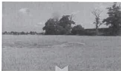
Le bosquet Rosalie et une mouillère un peu au sud, éléments du corridor écologique

Une partie du site devra être maintenue en zone agricole , même en dehors du couloir des lignes Haute-Tension. Une agriculture raisonnée (voire biologique) et intégrée dans des circuits courts (AMAP...) permettra d'intégrer cet usage au fonctionnement global de la commune et d'impliquer les habitants. Il pourrait être planté des vignes ou des vergers.