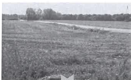
Une vue de la route de Monthéty

Une partie du site devra être maintenue en zone agricole , même en dehors du couloir des lignes Haute-Tension. Une agriculture raisonnée (voire biologique) et intégrée dans des circuits courts (AMAP...) permettra d'intégrer cet usage au fonctionnement global de la commune et d'impliquer les habitants. Il pourrait être planté des vignes ou des vergers.