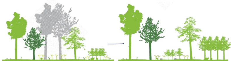
La futaie irrégulière : une coupe réalisée tous les 8 ans environ, pour amener progressivement la forêt vers un mélange équilibré d'arbres de différents âges et tailles.

permanence toutes les phases de la vie d'un peuplement forestier, tous les types de coupes suivants sont pratiqués au sein des