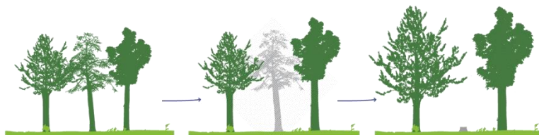
L'amélioration : une coupe pour redonner de la lumière aux arbres les plus sains.

peuplements forestiers, tout en veillant à préserver la biodiversité